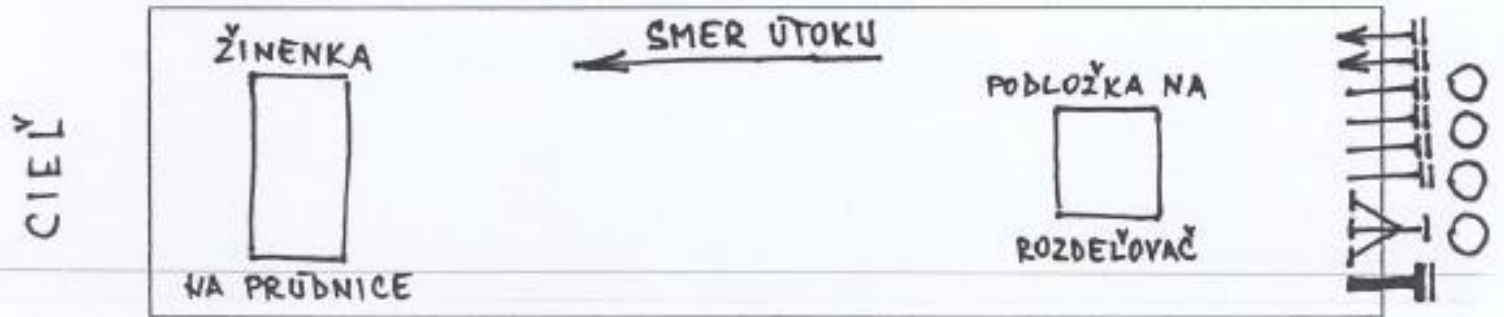
Schéma postavenie technických prostriedkov po ukončení disciplíny.